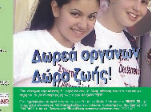
Το ενημερωτικό φυλλάδιο το οποίο διανεμήθηκε.